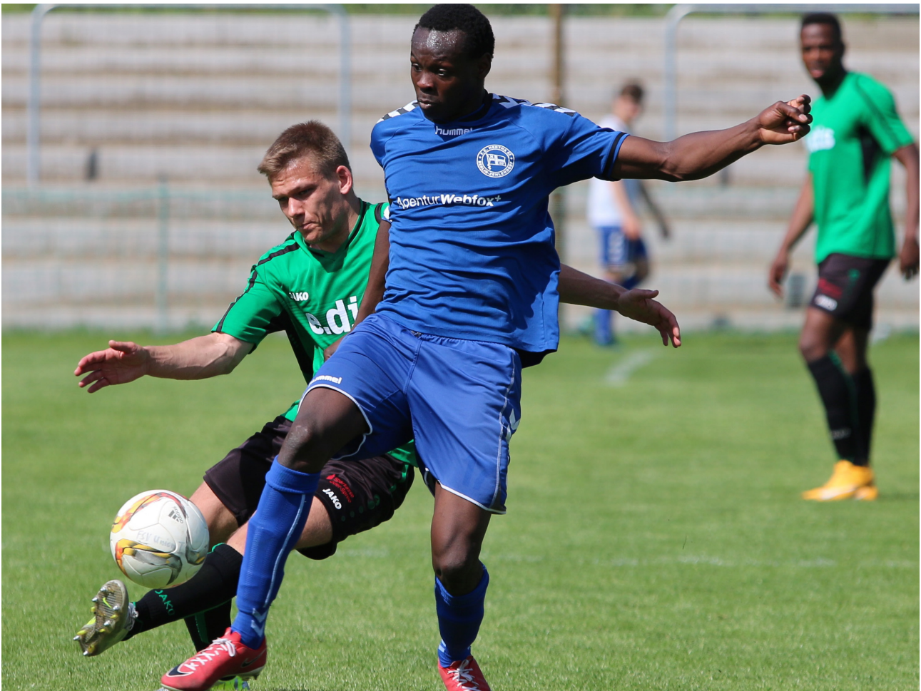
Letztes Heimspiel der Saison 2015/16 am Sonntag, 05.06.2016 gegen Brandenburg SC Süd 05