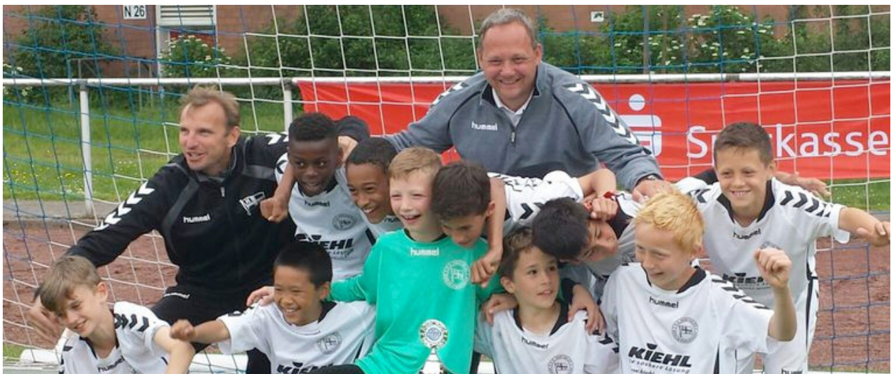
1. E-Junioren (U 11) gelingt der große Coup beim Top-Turnier in Halle/Westfalen